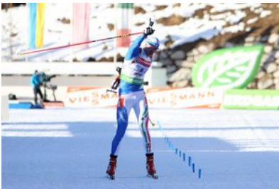
Biathlon Weltcup