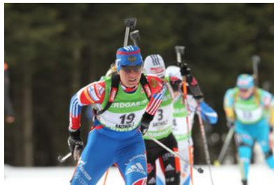
Biathlon Weltcup