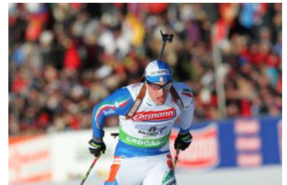
Biathlon Weltcup